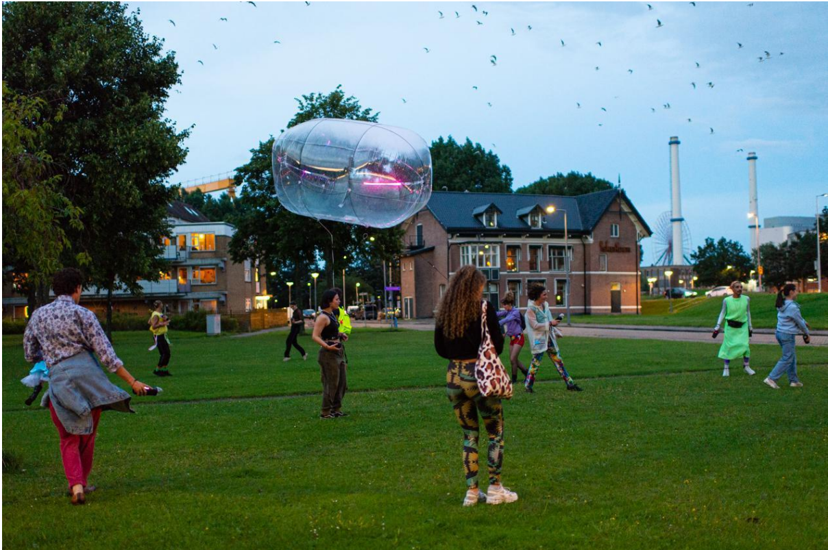
RÆV REHEARSAL N°8, Tools for Action + Floor van Leeuwen, Rotterdam 2021