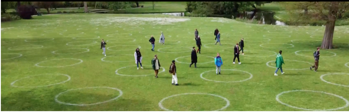
Still van Swarm Rehearsals, Tools for Action + Floor van Leeuwen, Rotterdam 2021