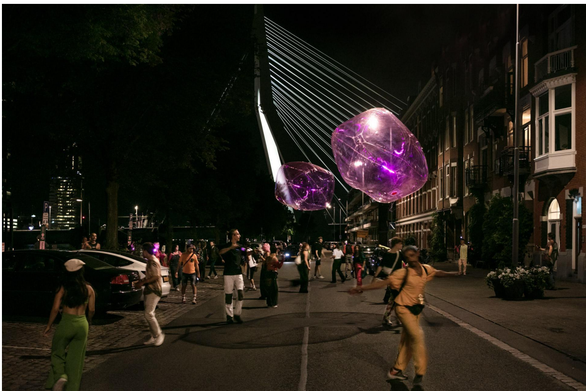
RÆV REHEARSAL N°10, Tools for Action + Floor van Leeuwen, Rotterdam 2021