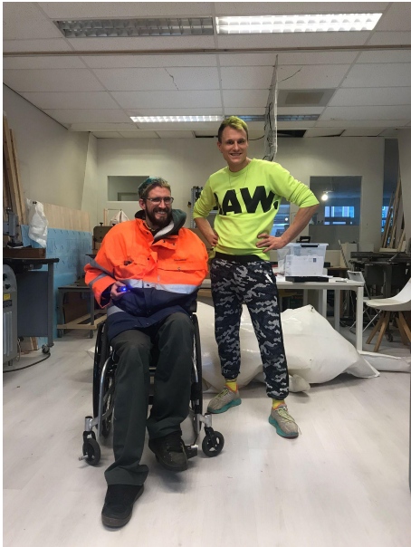
Boven: Wonko en Artúr in 2021.