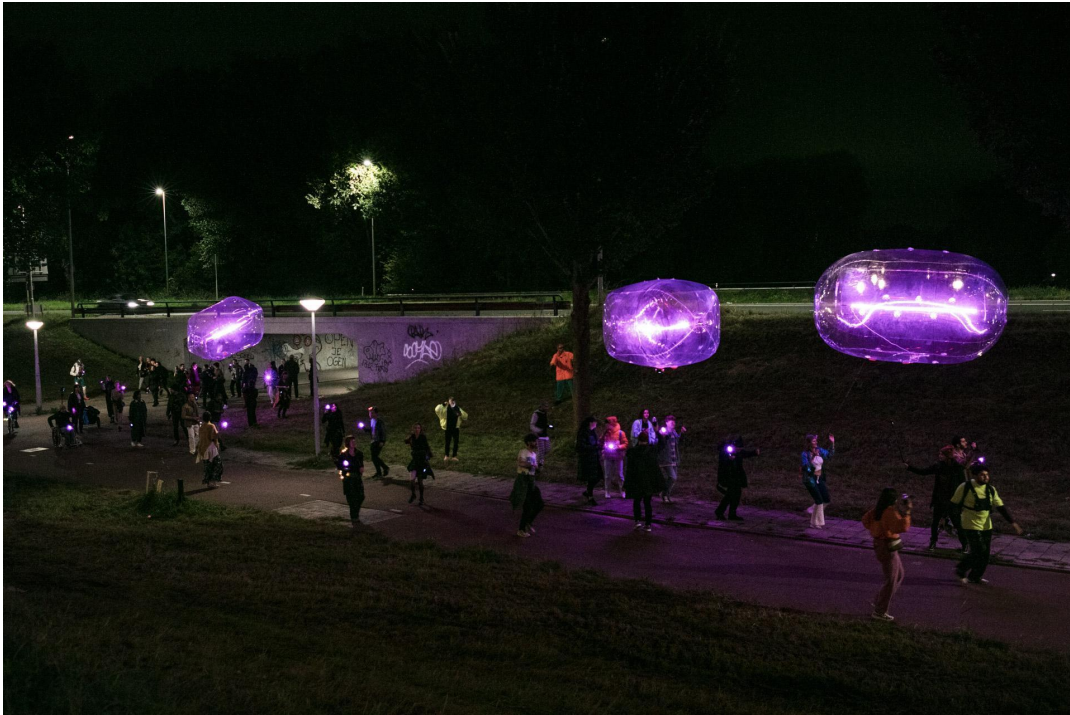
RÆV REHEARSAL N°8, Tools for Action + Floor van Leeuwen, Amsterdam 2021