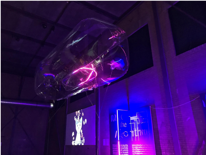
Above: Helikite installatie op Fake Me Hard tentoonstelling op AVL Mundo.

In mei 2021 vonden op vier zondagmiddagen Swarm Rehearsals plaats in Rotterdam als manier om samen te komen tijdens de pandemie, gesubsidieerd door de Balkonscène van het Fonds Podiumkunsten.